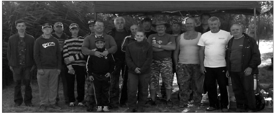
A versenyzők és a szurkolók