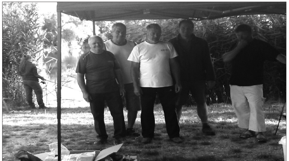
Az elnökség tagjai